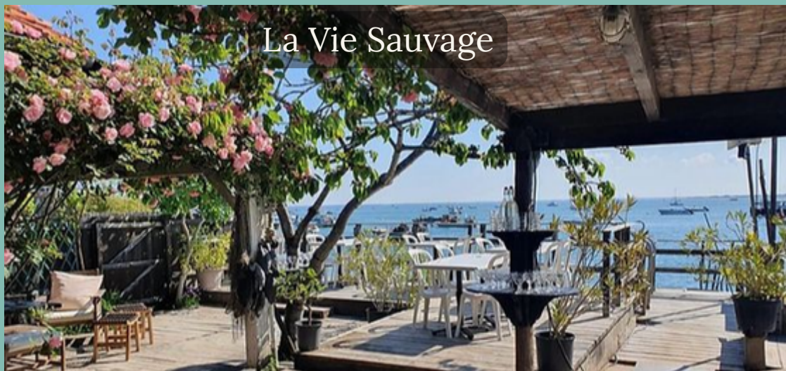
La Vie Sauvage

Expert en dégustation d'huîtres, pour la découverte d'une expérience unique dans un cadre magique